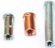
KOŁEK DO ZGRZEWANIA IT ALU STCU A2