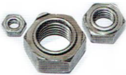
NAKRĘTKA ZGRZEWALNA DIN 929 ST, A2