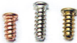
KOŁEK DO ZGRZEWANIA PT GRUBO GWINTOWANY STCU MS