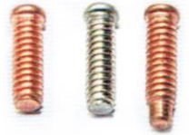
KOŁEK DO ZGRZEWANIA PS STCU A2