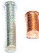
KOŁEK DO ZGRZEWANIA UT ALU STCU A2 M5