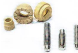
BOLEC DO ZGRZEWANIA RD ST A2 + OSŁONKA CERAMICZNA